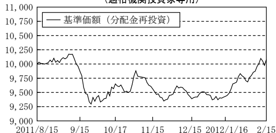
イーストスプリング・アジア・ソブリン・ファンド (適格機関投資家専用)

※基準価額 (分配金再投資) は、決算日に課税前分配金を全額再投資した場合の値であり、かつ2011/8/15の基準価額を10,000として指数化した値です。